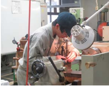
▲丁寧な作業を心がけて