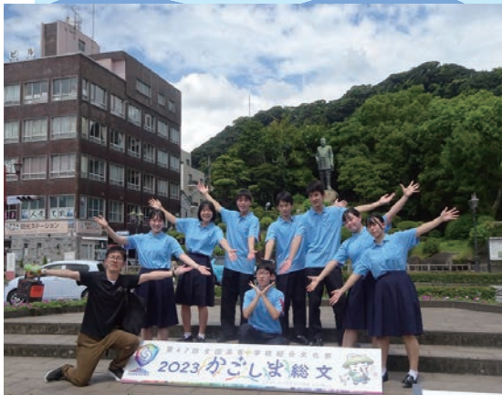
▲長工の選抜メンバーで記念撮影

吹奏楽部門は七月三十一日、八月一日に鹿児島県宝山ホールで行われました。会場には地元の人など多くの人が訪れていました。吹奏楽部門に長崎県を代表して出場したのは「がんばらんば県南吹奏楽団」メンバーはオーケストラを経て選ばれた県南地区の高校の吹奏楽部員。本校からは8名が参加しました。