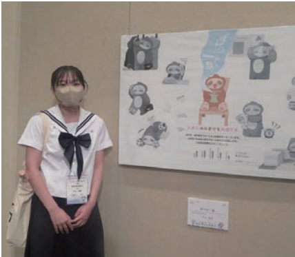
▲作品と笑顔でツーショット

「Q これからの目標を教えてください」 「自分が作ったキャラクターの人に、嬉しそうに答えてくれるように」