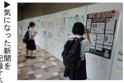
▲気になった新聞を記録する

「Q これからの目標を教えてください」 「自分が作ったキャラクターの人に、嬉しそうに答えてくれるように」