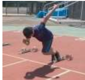
▲軽快なスタートダッシュ