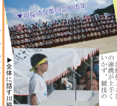
祝長崎工業創立80周年