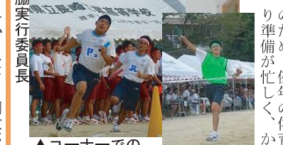
▲コーナーでの競り合い ▲やったぜ一位!

十月八日に本校グラウンドで開催された体育祭。天候は快晴。今年は創立八十周年を意識した組体操などいつもと違う一面も。今年もまた、各科の熾烈な戦いが繰り広げられました。