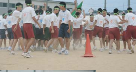
勝利を全身で喜ぶ