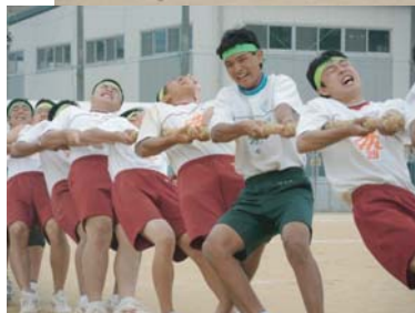
▲皆の力を綱にこめて ▼全速力で100m

①目標としていた二連覇を達成できてほっとしている。 ②九十点。 ③バレーと応援幕で賞が取れなかった。