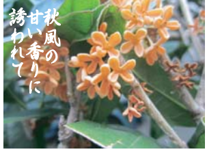
秋風の甘い香りに誘われて